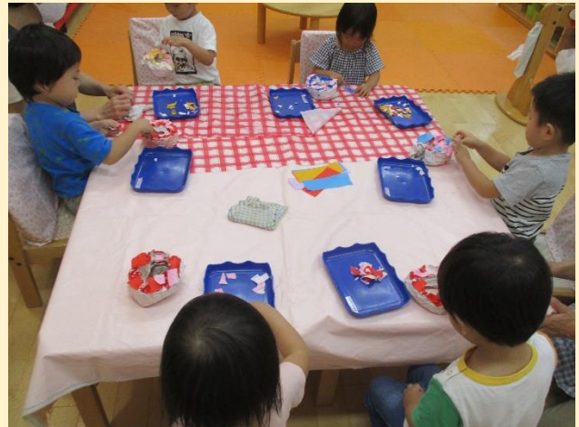
ビリビリ、グシャグシャと紙の感触を楽しみながら、特製のドーナツを作りました！