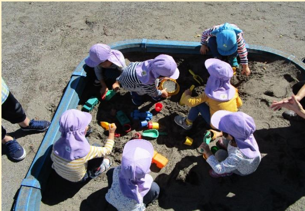
久しぶりの砂場、女の子たちは型を使ってケーキ屋さんです！男の子たちは、大好きなトラックやヒコーキを砂に埋めて宝探しに夢中です。

また、昼夜の気温差がある季節です。衣服の調節などを行いながら、子どもたちの健康に気を付けて過ごしていきたいと思います。