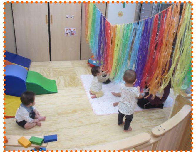
* すずらんテープのレインボーカーテンぐり *