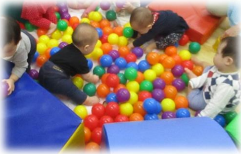
みんなでボールプール、とても楽しそうです♪

子ども達もすくすくと成長し、人見知りで泣いたり好奇心でいろいろな物を触ったり、ハイハイや一人歩きなど活動範囲も広がってきています。天気の良い日は戸外に出かけ、爽やかな風や草や木々など自然物に触れたり目と肌で感じ楽しんでいきたいと思います。