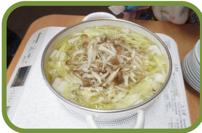
調理保育では、お味噌汁づくり・おにぎりづくりに挑戦しました。