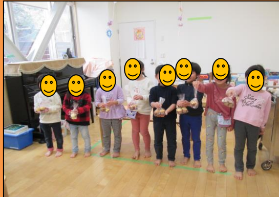
親子会食、大成功したね！！ いつもありがとう 感謝の気持ちをプレゼント♡

保護者の皆様には、お忙しい中たくさんのご協力をいただき、支えていただきました。本当に感謝しております。保育園最後の日まで一日一日を大切にすごしていきます！！ありがとうございました！