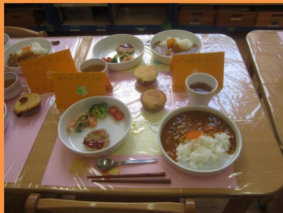
手作り味噌で親子会食開催♡大成功！