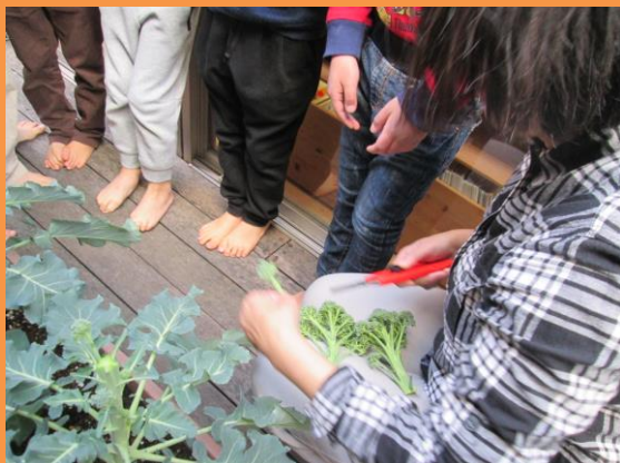
最後の収穫。大きくなったブロッコリー！

八千代保育園でお友だちと、たくさん遊んで、泣いて、笑って過ごすのも、あと1か月となりました。卒園式に向けて様々な活動中、自分の入学する小学校を教えあう姿をみせているらいおん組です。ぞう組さんに、おはよう当番を引き継いで教えてあげる姿から、成長し自信とやる気にあふれた様子が見られ、頼もしさを感じます。これまで子どもたちが見たこと、覚えたこと、経験したことは数えきれないことと思います。改めて子どもたちの持つ未来への力に向けて、素晴らしさ感じています。保護者の皆様には、お忙しい中たくさんのご協力をいただき、支えていただきました。本当に感謝しております。ありがとうございました。子ども達との別れをさびしく思いますが、保育園最後の日まで一日一日を大切にすごしていきます！！