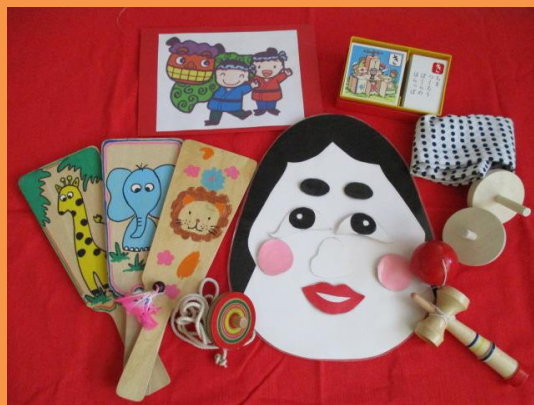
幼児3クラス制作クリスマスツリー完成！ いろいろなお正月遊び。コマの模様かき楽しみです。