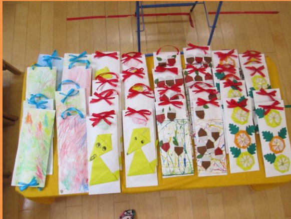
七五三の千歳飴袋では、菊折りに挑戦しました。

空気がすっかり冷たくなりました。子どもたちは、先日の雪を見て冬の訪れを感じているようです。楽しみにしていた八国山ハイキングは、1週間延期しましたが天候にも恵まれて、元気に出かけることができました。秋の終わりとなり、クヌギどんぐり集めは少なく残念でしたが、広場でのバッタやトンボ採り、尾根道でのキノコ発見、クラスの仲間との尾根道歩き、楽しいお弁当時間、木登りと五感を開放して遊べた経験ができました。「楽しかったー!」「みんなにバッタとトンボ見せたい」「木登りできた!」「お弁当美味しかった」「また、行きたいね」と帰り道の会話に、私たちも嬉しさが増します。青柳保育園ご招待のお店屋さんごっこでは、ちょっと緊張しつつも「こんにちは」「いくらですか?」「これください」とやり取りを楽しみながら参加させてもらいました。1月の関口台町小学校訪問では、5歳児クラスのお友だちに、また会える機会もあります。交流の機会を大切にしたいと思います。今月は、劇、歌と合奏、太鼓をお楽しみ会に向けて、お友だちと共通の目的を持ち、イメージを共有して作り上げていきます。参加を喜び合い、満足感や達成感をみんなで味わうことを目指していきたいと考えます。ご協力いただくことも多くあるかと思いますが、よろしくお願いします。