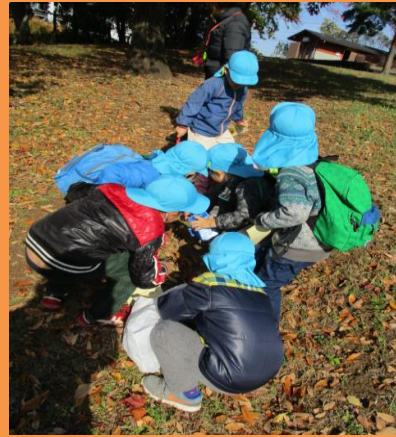
八国山で見つけた宝物はなにかな!?