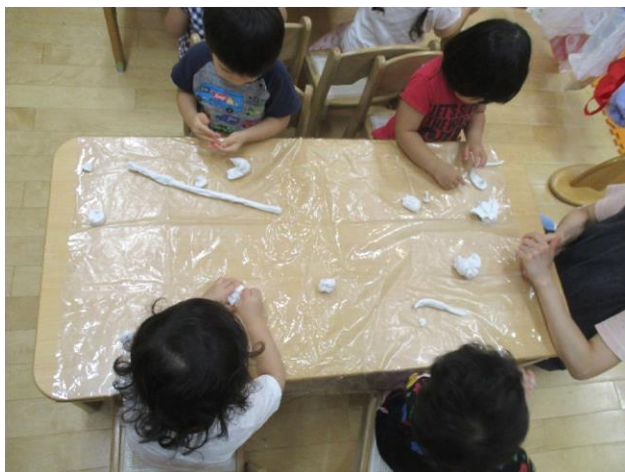
こねて伸ばして…パンやケーキを作ります!

子どもたちの体調の変化には引き続き気をつけながら、元気に楽しく秋を迎えたいです。