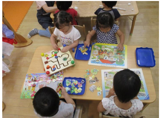
難しいパズルも一生懸命考えて、最後まで頑張っています!