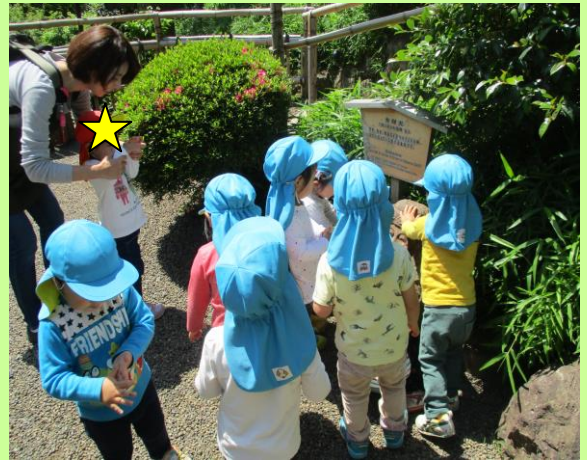
“弁天様に手を合わせたり、頭を撫でています”