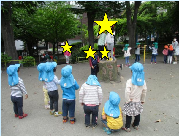
“らいおんぐみのリサイタルショー見学中♪”

梅雨が明けると本格的な夏の到来です。気温の変化が激しく体調を崩したり食欲が落ちて疲れやすい時期でもありますので、体調管理や衣服調節に気をつけ、水分補給や休息を十分にとりながら健康に過ごしたいと思います！