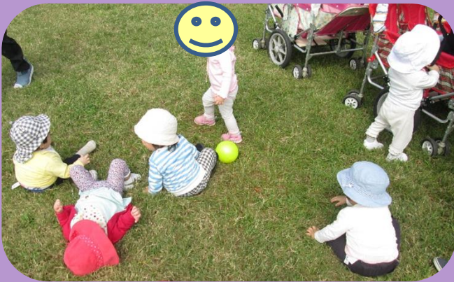
芝生の感触が気になる子どもたち…