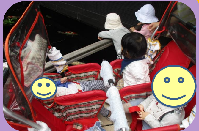
護国寺では大きな鯉を見てきました♪