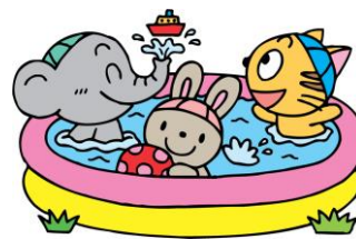
園児募集（8月1日現在）